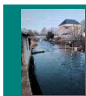
Le Clain à Chasseneuil du Poitou (26/01/2017)

Après des semaines de sécheresse hivernale, les pluies ont repris durant la première semaine de février, avec au 15 février : 39,7 mm de pluies à Poitiers , 34,8 mm à Niort , 50,1 mm à Cognac (proche de la normale), et 35 mm à La Rochelle . Cependant, encore la quasi-totalité des niveaux piézométriques du réseau picto-charentais se situe sous la moyenne interannuelle et 20% des niveaux sont sous les minima .