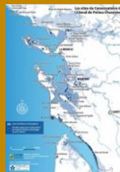
Les sites du Conservatoire du Littoral de Poitou-Charentes en 2016