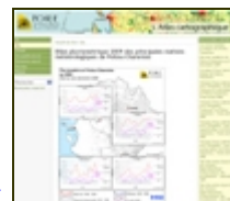
Illustration de l'Atlas cartographique Consultez les dernières cartes mises en ligne : Etat des aquifères de Poitou-Charentes au 28 février 2010 / Les principaux séismes en Poitou-Charentes / Les périmètres d'inventaires du patrimoine naturel en 2009 / Les zones de protection du patrimoine naturel / Détermination du potentiel d'accueil du milieu pour le Castor d'Europe ... Atlas cartographique